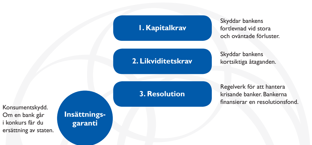
Figur. Bankernas skyddssystem

Utöver detta finns även insättningsgarantin som ett direkt skydd för konsumenter.